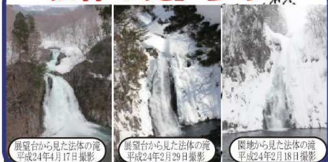
展望台から見た法体の滝 平成24年4月17日撮影 展望台から見た法体の滝 平成24年2月29日撮影 園地から見た法体の滝 平成24年2月18日撮影