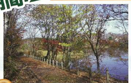
1 はなだて 花立高原牧場(チップロード)

路面に間伐材チップを敷きならした全長約3キロの散策路で、花立牧場公園内の景観スポットを徒歩で回ります