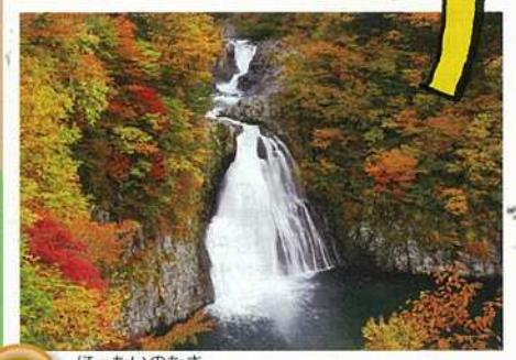
3 ほったいのたき 法体の滝

日本の滝100選に選定されている。2009年に公開された映画「釣りキチ三平」のロケに使われた