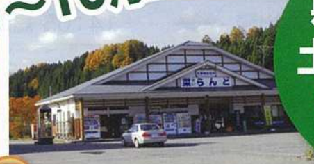
5 さい 菜らんど

「地産地消」新鮮なものを安く売ることがモットーの菜らんどは、一年中「旬」の品でいっぱい