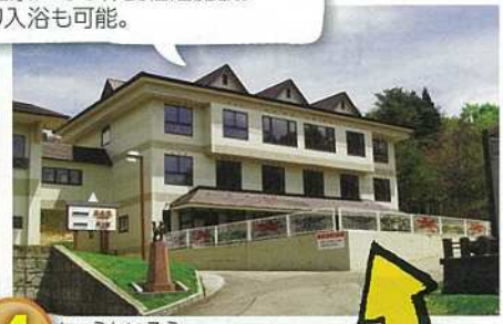
4 ちょうかいそう 鳥海荘